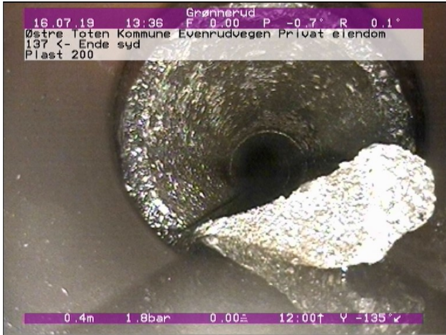
Foto: 9_1_2_16072019_133117_A.JPG 0,41m, Materialending til Betong