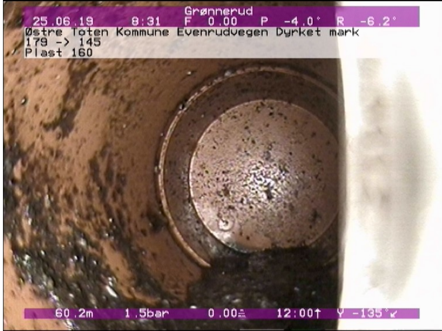
Foto: 1_1_4_25062019_082609_A.JPG 60,17m, Plugget tilkopling 03 Kl., prefabrikeret