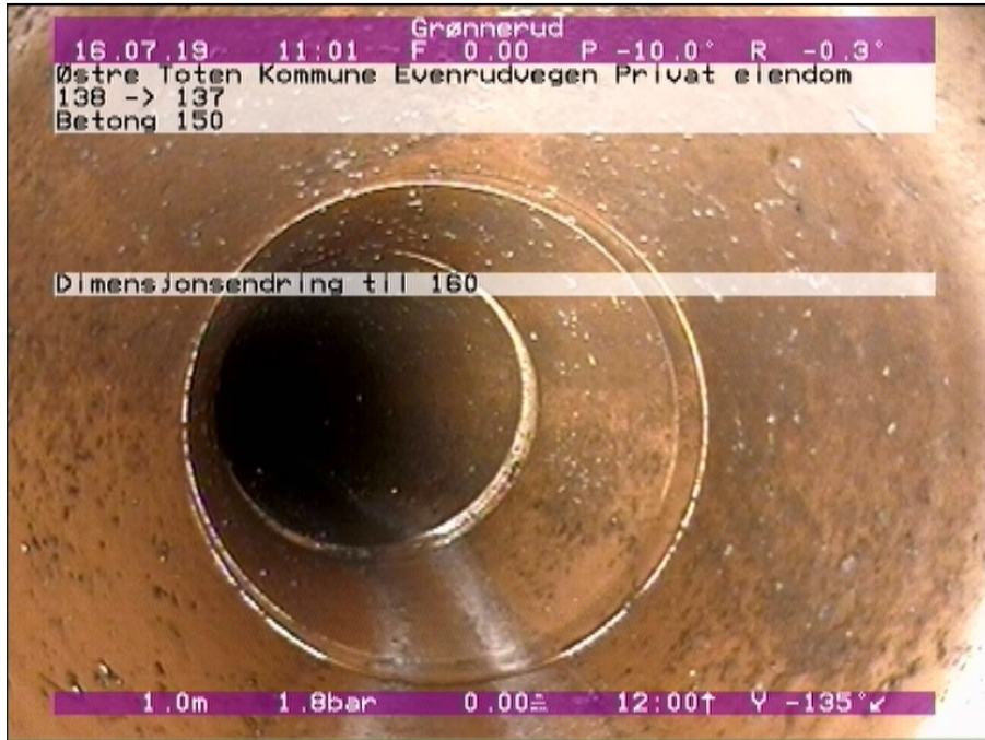
Foto: 5_1_3_16072019_105608_A.JPG 1m, Dimensjonsendring til 160