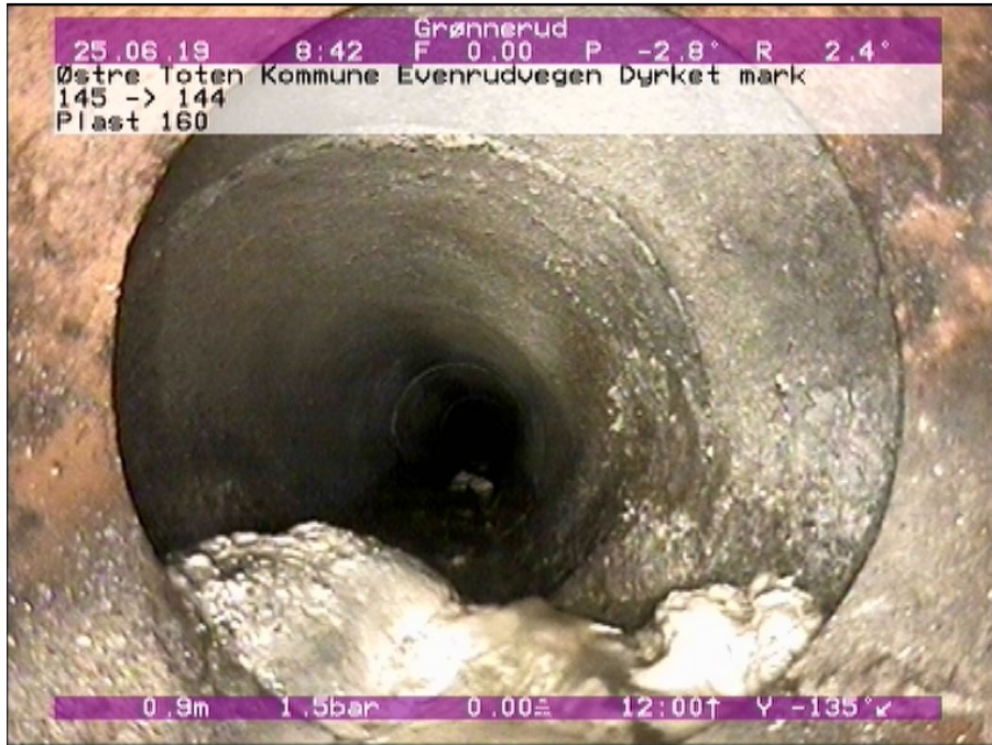
Foto: 2_1_2_25062019_083642_A.JPG 0,9m, Materialendring til Betong